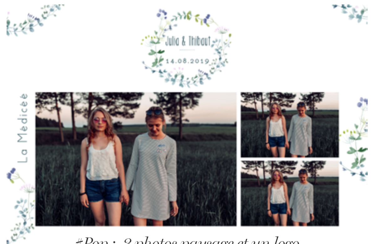
#Pop : 3 photos paysage et un logo