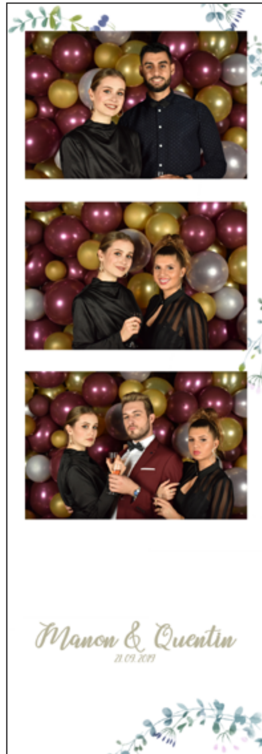
#Strip : 3 images et un logo