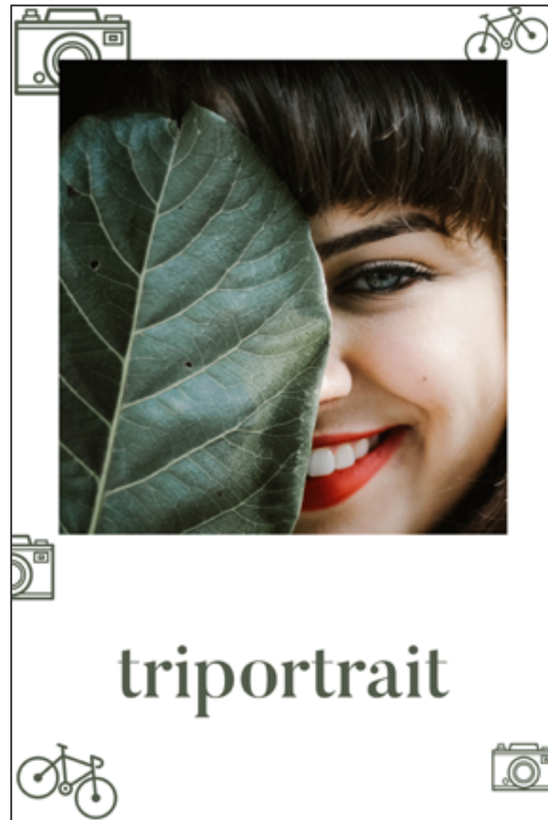
#Pola : 1 image portrait et un logo