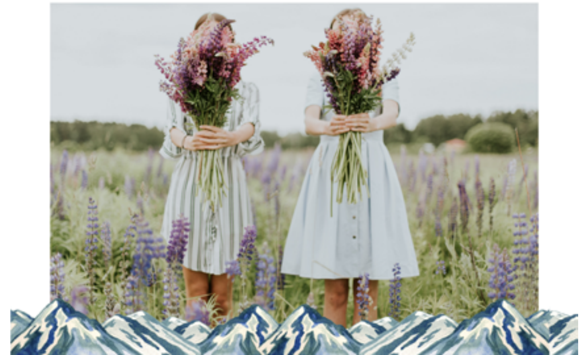
#Paysage : 1 photo paysage et un logo